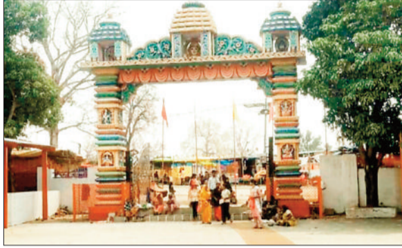
हरिमूमि न्यूज | बैकुंठपुर

शक्ति की उपासना का महापर्व चैत्र नवरात्र गुरुवार से श्रद्धा और उल्लास के साथ शुरू हो गया। इस श्रद्धालुगण सुबह से ही देवी मंदिरों में मत्था टेककर पूजा-अर्चना कर मनोकामना की। वहीं इस दिन देवी मंदिरों में कलश स्थापना के साथ ही शक्ति के देवी की आराधना शुरू हो गई। नवरात्र के पहले दिन माता के शैलपुत्री रूप की श्रृंगार कर विधि-विधान के साथ पूजा-अर्चना की गई और माता को भोग चढ़ाया गया। इस अवसर पर देवी मंदिरों में