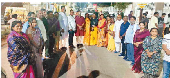
लोकार्पण करते महापौर सहित अन्य जनप्रतिनिधि।

शहर के विभिन्न वार्डों में स्थापित किए गए स्ट्रीट लाइट का महापौर, भाजपा जिलाध्यक्ष, सभापति व पार्षदों ने लोकार्पण किया। जनप्रतिनिधियों ने साईं मंदिर और चांदनी चौक के समीप स्थित टाइमर बॉक्स का बटन दबाकर स्ट्रीट लाइट का लोकार्पण किया।